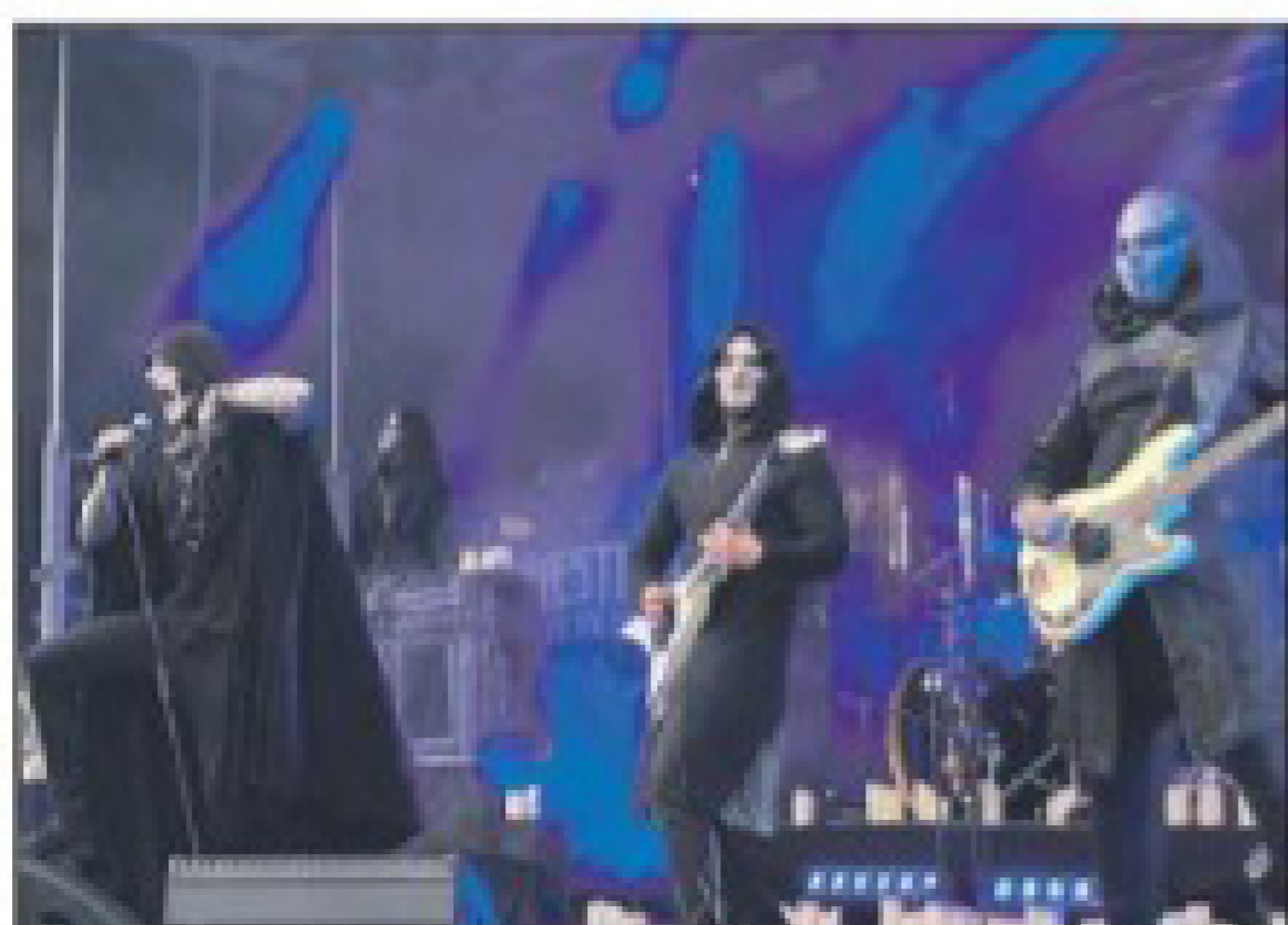
Det danske black metal band Lamenta er gæstede Næstved Metalfest sidste år. Det er nok ikke det sidste, man har hørt fra de sortklædte københavnere.

Og så er smut tilbage til renessancen. Har man lyst til at tjække John Miltons udgave af »Paradise Losts, så prøv den, der er illustreret af romanikeren Gustavo Doré - den spinkle sorte sreg er ret meget metal. Så får man lige den ekstra oplevelse med.