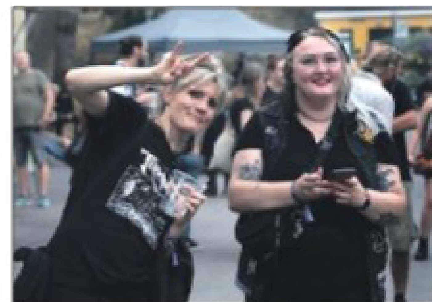
Metalfestivalen i 2022 var en musikalsk succes, men der kom ikke nok gæster. De, der kom, havde dog en fest.