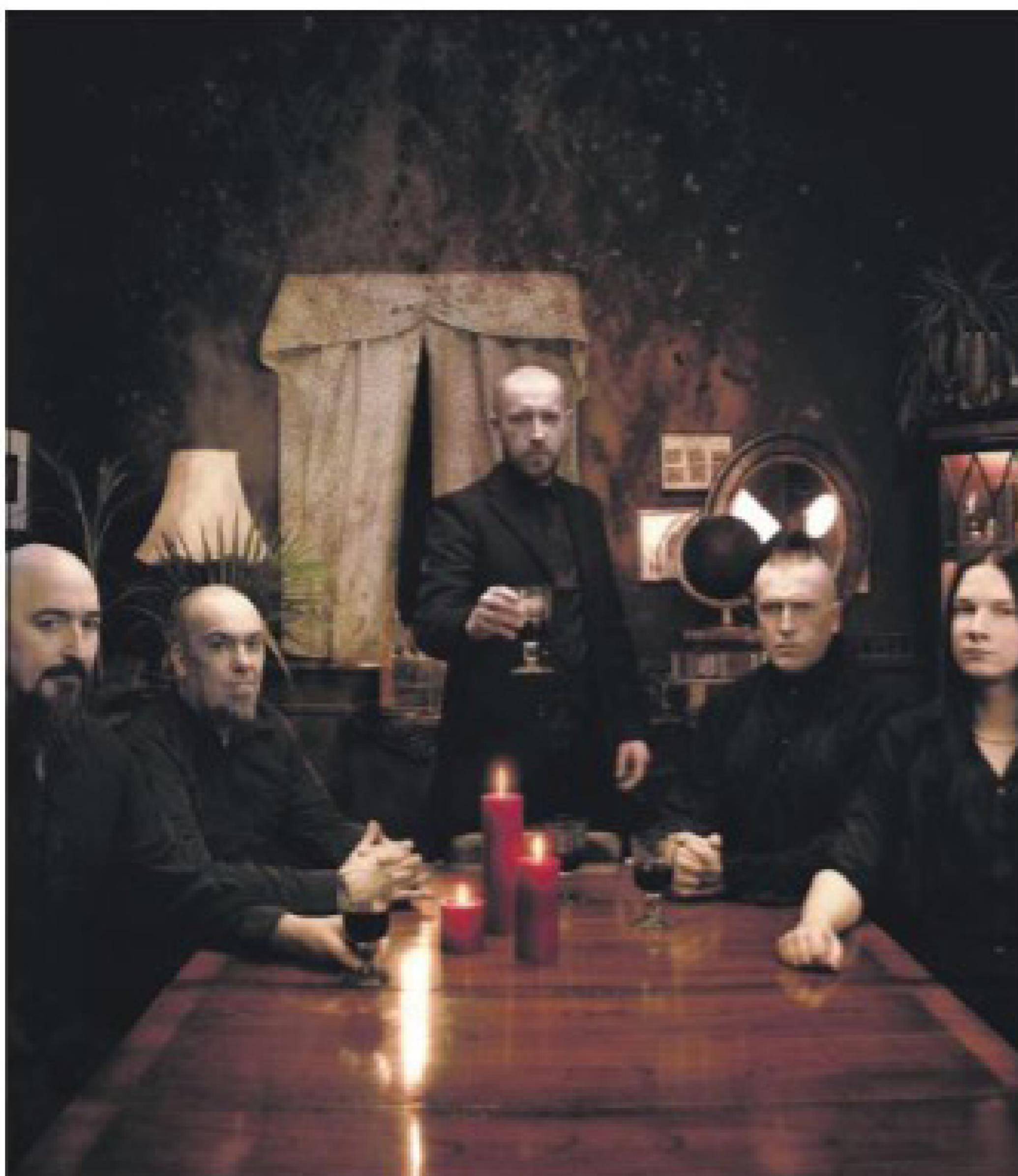
Paradise Lost bliver det store hovednavn på Næstved metalfest i 2023. Bandet kommer fra England og har siden udsendelsen af albummet Draconian Times hørt til i toppen inden for genrene doom og gothic. Paradise Lost har altid været svære at sætte i bås. De flest vil kalde musikken gothic, doom og death, men lyt til for eksempel albummet One Second, der får tankerne hen på Depeche Mode.

De skyder med skarpt Udover Paradise Lost og